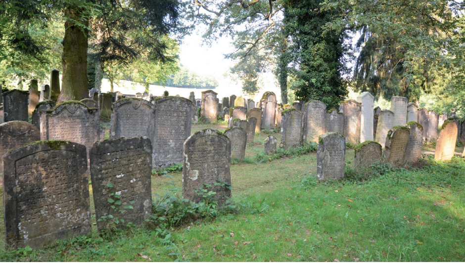
Jüdischer Friedhof zwischen Endingen und Lengnau (1750) / Jewish cemetery between Endingen and Lengnau (1750)