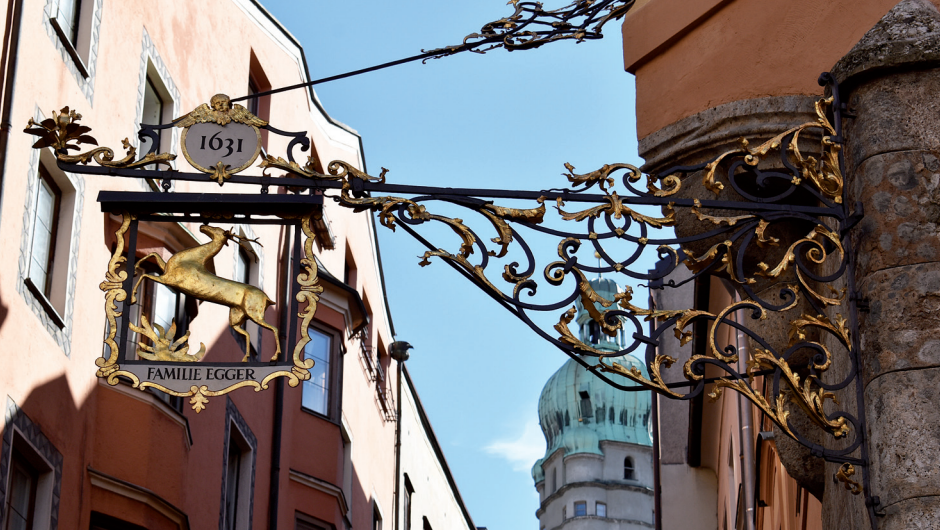
Innsbruck, Gasthaus „Zum Goldenen Hirschen“ / Innsbruck, Hotel "Zum Goldenen Hirschen"