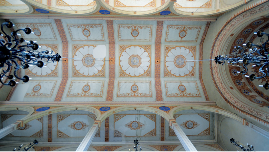
Synagoge Lengnau (1847, Restaurierung der Fassaden 1983–84) / Lengnau Synagogue (1847, façades restored in 1983–84)