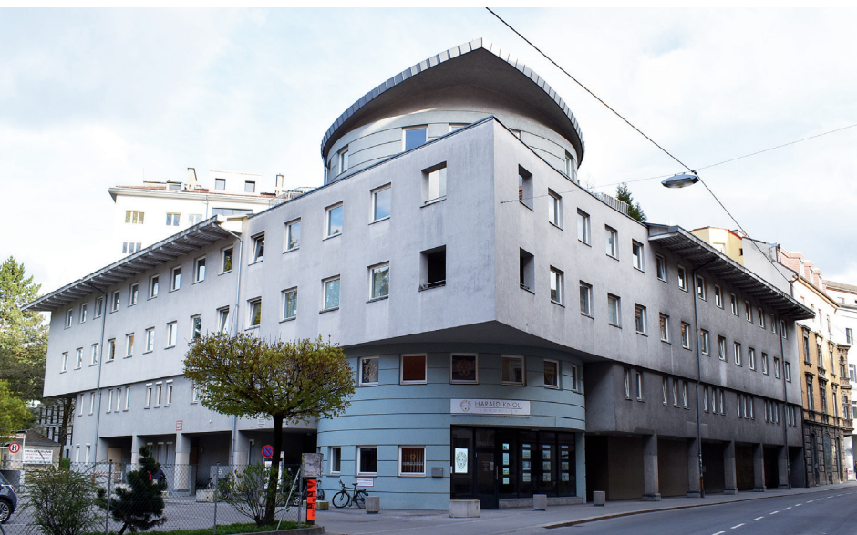
Innsbruck, jüdisches Gemeindezentrum / Innsbruck, Jewish Community Center

The ensuing discussion, based on the presentations revealed, revealed just how diverse the perception of architecture in Palestine/Israel can be. Building construction and the understanding of architecture have social and political relevance are especially apparent in Israel. The Study Day 100 Years of Planning and Building in Palestine and Israel demonstrated this and sparked considerable interest in continued planned research projects and in the upcoming publication of the conference contributions in the Innsbrucker Beiträge zur Baugeschichte.