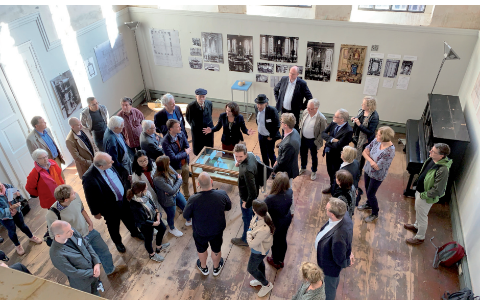
Teilnehmer in der Klausssynagoge der Moses Mendelssohn Akademie Halberstadt / Participants in the Klaus Synagogue of Moses Mendelssohn Akademie in Halberstadt