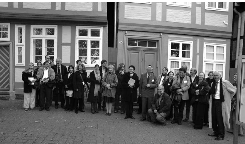
Teilnehmer des internationalen Kongresses „Jewish Architecture in Europe“ vor der barocken Synagoge in Celle am 11. Oktober 2007/Participants of the international congress „Jewish Architecture in Europe“ in front of the baroque Synagogue in Celle on 11 th October 2007.

Questions concerning the organization and financing made the participating institutions (TU Braunschweig, Hebrew University of Jerusalem, Ministry for Sciences and Culture in Lower Saxony and the State of Lower Saxony) postpone the establishment of the foundation. It was supposed to take place in October of 2007 during the congress “Jewish Architecture in Europe”, together with an exhibition of wooden models of synagogues. However, only part of the programme was realized: the congress in the TU Braunschweig, which was a great success, with participants from sixteen countries. We would like to take this opportunity to thank again the Stiftung Braunschweiger Kulturbesitz (SBK) and its director Mr. Tobias Henkel for the generous support.