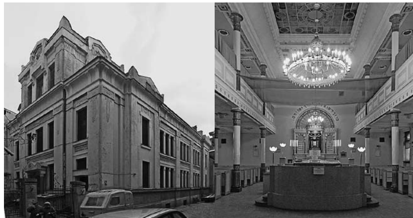
l: Old Riga, Synagogue in Peitavas Street (1905), View from south-west/Alt Riga, Synagoge Peitavas Straße (1905), Ansicht von Südwesten (Kravtsov 2007).

Der Besuch hat ergeben, daß weitere Dokumentationen und Untersuchungen zum gebauten Jüdischen Erbe in Lettland notwendig sind. Die Vorbereitungen für eine weitere Forschungsreise nach Lettland in 2008 haben bereits begonnen.