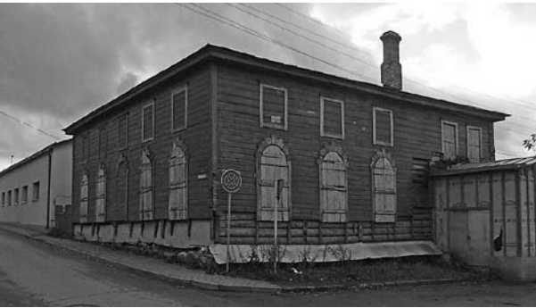
Rēzekne, Green Synagogue, view from north-west/Rositten, „Grüne Synagoge“, Ansicht von Nordwesten (Kravtsov 2007).

Im Oktober 2007 führte das Center for Jewish Art eine Forschungsreise nach Lettland durch, deren Ziel ein Überblick über die noch erhaltenen Synagogen war. Bereits im Vorfeld konnte die vom Center geführte Liste von Gebäuden, die in historischen Quellen genannt werden, in Kooperation mit Herrn Meijers Melers vom Jüdischen Museum in Riga, den örtlichen lettischen Museen sowie den jüdischen Gemeinden überprüft und verifiziert werden. Auf dieser kurzen Reise konnten dann innerhalb von neun Herbsttagen zahlreiche Ort besucht werden.