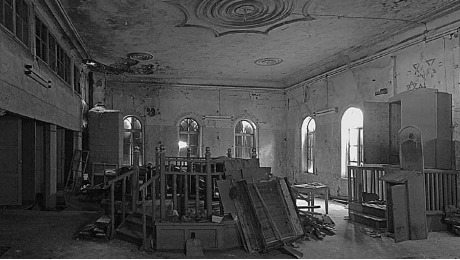
Rezekne, Green Synagogue, interior view towards north/Rositten, „Grüne Synagoge“, Inneres nach Norden (Kravtsov 2007).

ark, bimah and pews are now undergoing thorough conservation under the auspices of Latvian authorities and the World Monuments Fund. The Torah Ark, bimah, furniture, and even old prayer books are also preserved in nearby Ludza, where the Jewish community was re-established after the Holocaust, as it was in Rezekne. Regrettably, the fate of the Hassidic synagogue of Subate is much worse since it was converted in a workshop and a garage. The process of rotting and decay seems to be irreversible here.