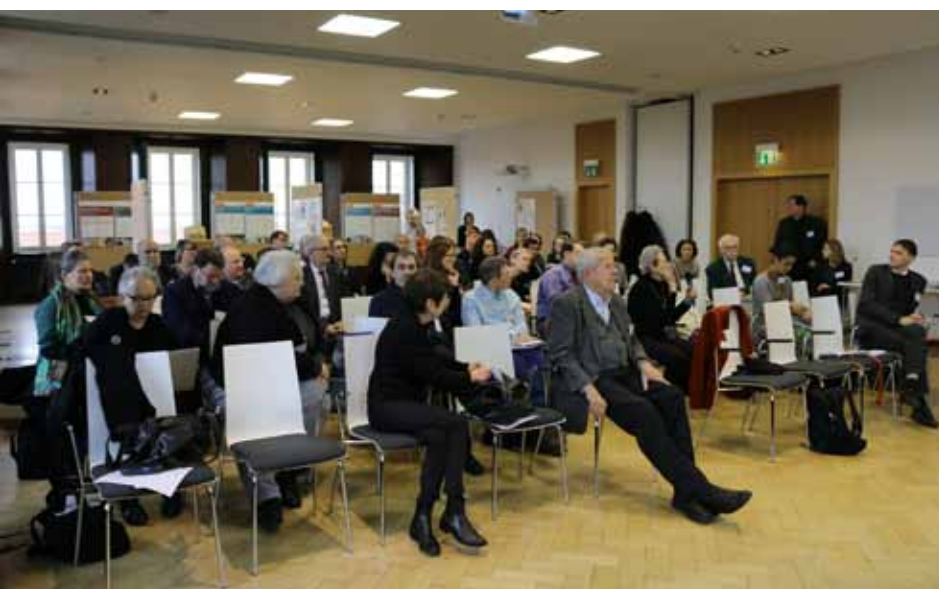
Conference participants during discussion / Konferenzteilnehmer bei der Diskussion.

Seit der Antike ist die Synagoge der Ort, an dem sich die jüdische Gemeinde regelmäßig zum Gebet aber auch zum sozialen Austausch versammelt. Ihre Lage, Architektur und Ausstattung sagt viel aus über