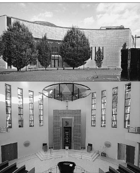
13 Aachen, Synagoge, Arch.: A. Jacoby, 1996, Ansicht von Westen