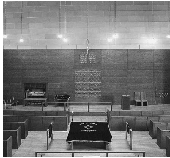
16 Dresden, Synagoge, Arch.: Wandel, Hofer, Lorch und Hirsch, 2002, Ansicht von Süden