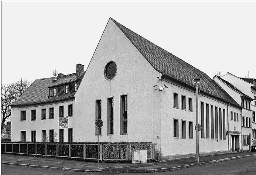
4 Erfurt, Synagoge, Arch.: W. Nöckel, 1953, Ansicht von Norden

in der Geschichte der DDR. 8 Man entschied sich zu einem Neubau am Standort der 1938 in Brand gesetzten und später abgetragenen Synagoge. Am 29. April 1949 wurde das Vorhaben der Baubehörde vorgelegt, der Erfurter Architekt Willy Nöckel hatte mit dem Datum 8. Mai 1948 schon einen entsprechenden Entwurf gefertigt. 9 Nachdem ein überkuppelter Rundbau als zu au ßig abgelehnt wurde, entstand nach Nöckels Plänen ein schlichter Saalbau mit etwa 200 Plätzen. Wie in dieser neoklassizistisch geprägten Phase der DDR-Architekturentwicklung üblich, verzichtet das Bauwerk weitgehend auf Elemente der Moderne, es ist darin aber durchaus mit den Synagogen in Stuttgart und Saarbrücken vergleichbar. Bis zum Ende der DDR entstanden keine weiteren Synagogenneubauten, die Gemeinden schrumpften auf wenige, vorwiegend ältere Mitglieder.