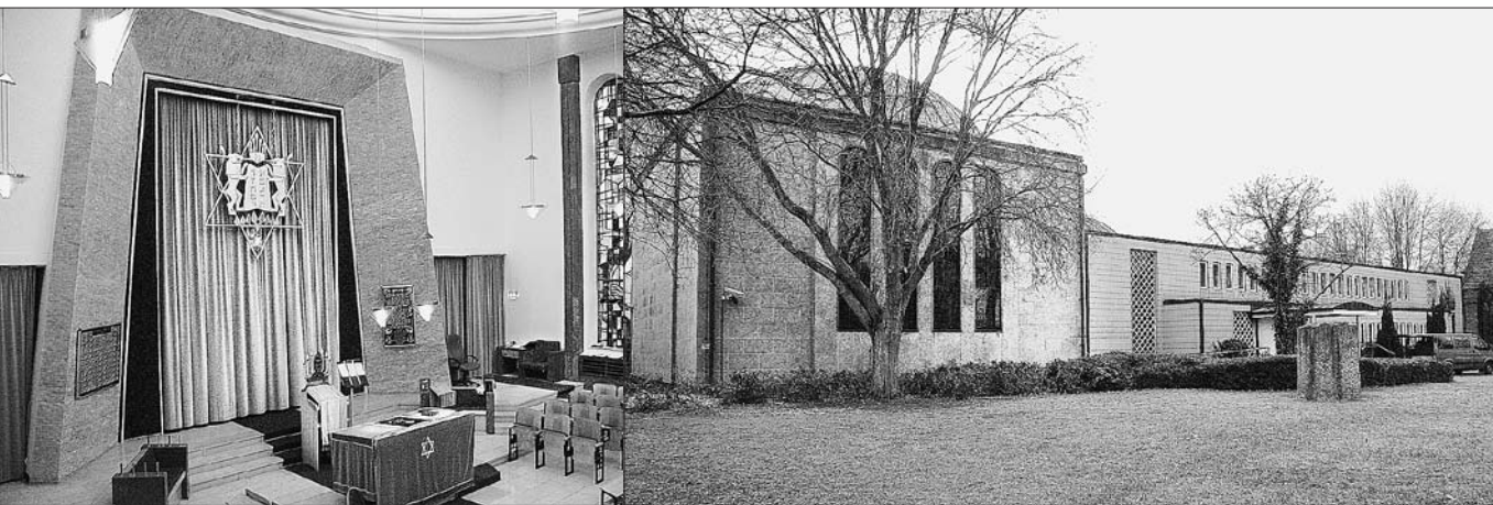
5 Bremen, Synagoge, Arch.: K. Gerle, 1961, Inneres nach Osten