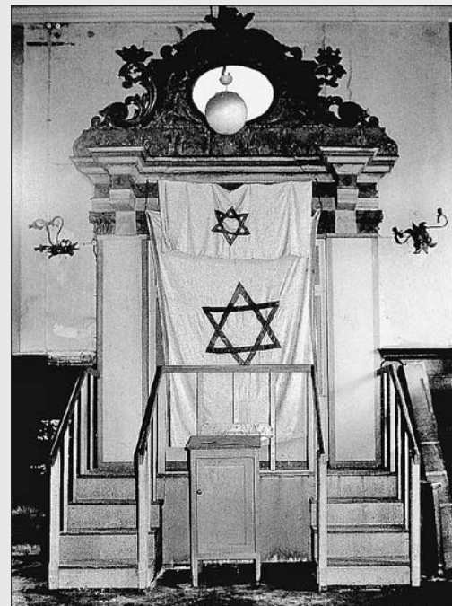
1 Celle, barocke Synagoge mit der Ausstattung für die jüdische DP-Gemeinde von 1945, Zustand vor 1974

Gleichzeitig mit den Gemeinschaften der DPs gründeten sich in vielen Städten kleine Gemeinden von Überlebenden, die in ihre Heimatsorte zurückgekehrt waren oder sich aus anderen Gründen nicht den Gemeinden der DP-Camps anschließen wollten. Eine solche Gemeindegründung fand zum Beispiel am 9. Juni 1945 in Stuttgart statt. 4 Diese frühen, zunächst ebenfalls provisorisch und auf Auflösung durch Auswanderung angelegten Gemeinden erfüllten wichtige soziale Funktionen für die Überlebenden, sie entfalteten aber auch neues religiöses Leben: In Stuttgart feierte man